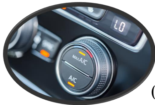
(H)FKW ( \leq 12.400 )