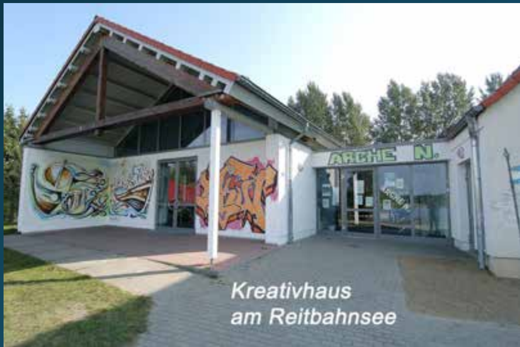
Kreativhaus am Reitbahnsee