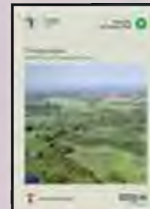
Naturparkplan Am Stettiner Haff