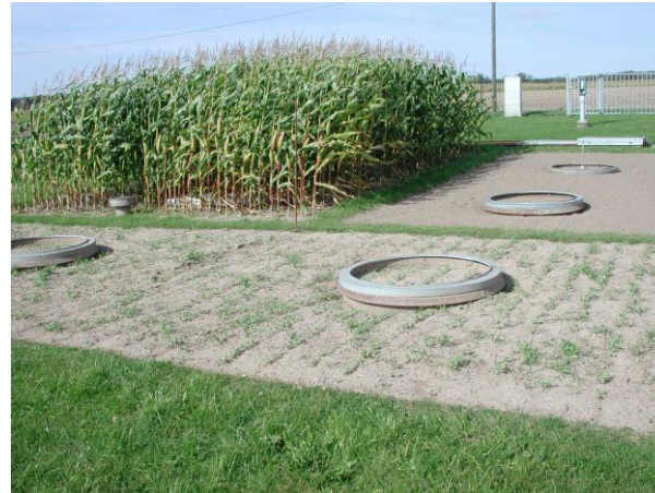
Lysimeterstation Groß Lüsewitz