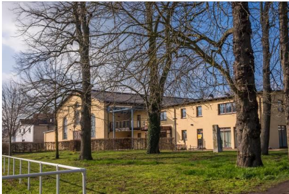
Der Tagungsort Bürgerhaus am Sonnenplatz in Güstrow.

Es wird eine Seminarpauschale in Höhe von 20,- EUR erhoben. Diese schließt eine Getränke- und Mittagsvorsorgung ein. Bitte entrichten Sie diesen Betrag zum Beginn der Veranstaltung.