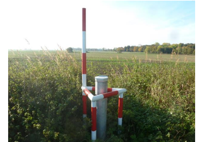
Grundwasserlandesmessstelle Barth